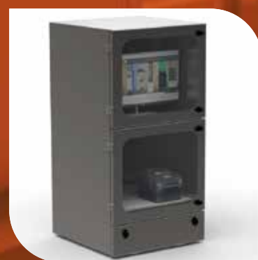
MU3 (PVC – INOX)

Gamme de Cellules de Protection AGRO à Rideau (PM / GM)