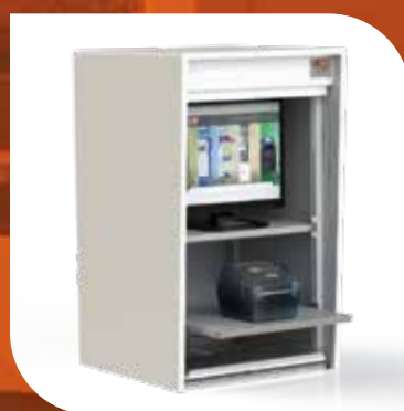
AGRO (PVC – PE – INOX)

Coffret de protection pour les imprimantes thermiques